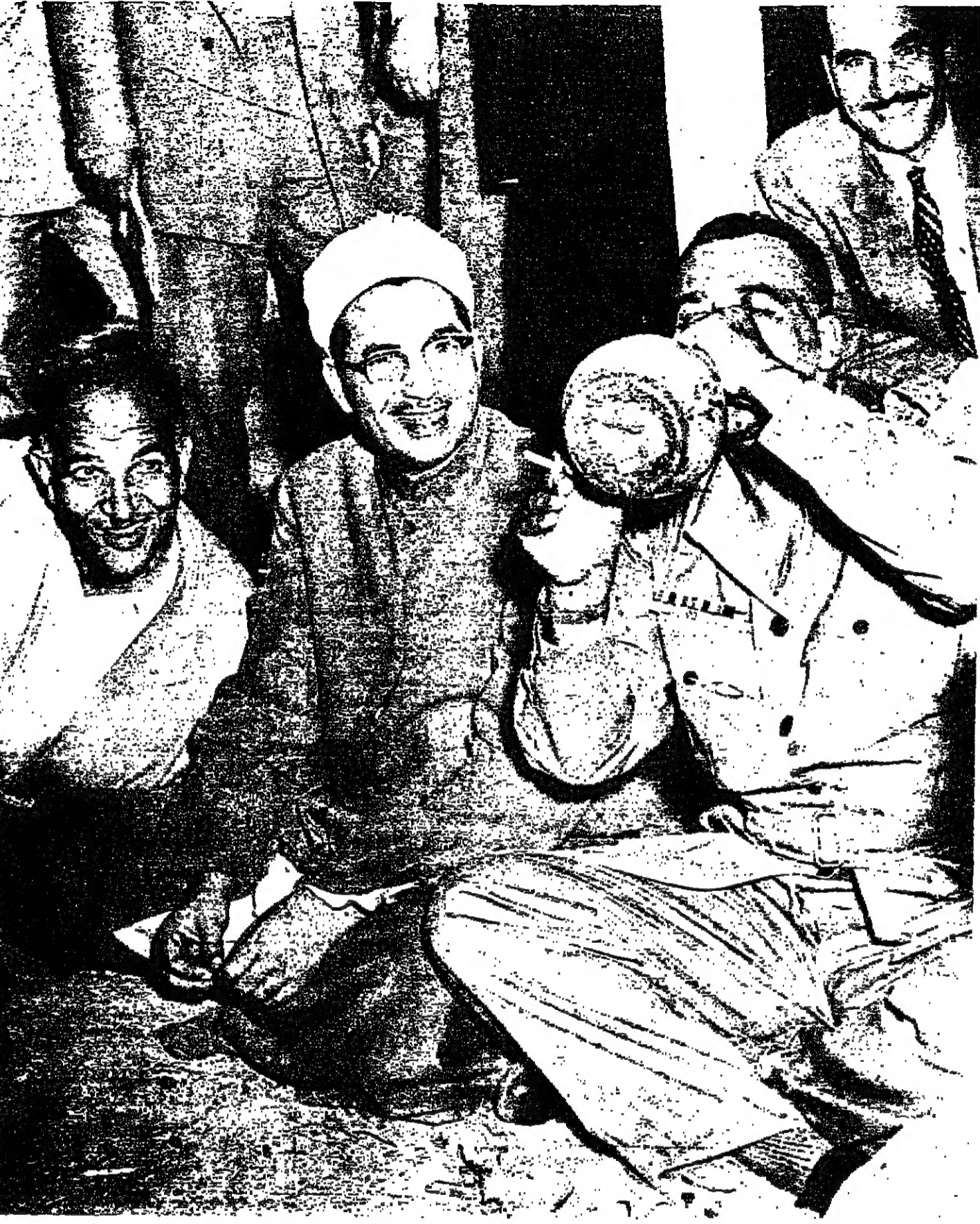
جمال عبد الناصر خلال زيارته لإحدى القرى